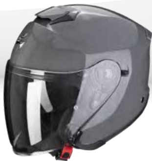
SOLID | Cement Grey 199,90 € | 88-100-253