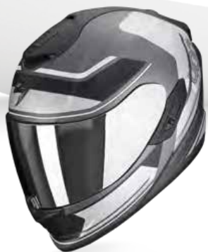
VITTORIA | Matt Silver-White 369,90 € | 114-384-208