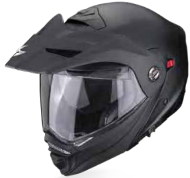
SOLID | Matt Pearl Black 249,90 € | 89-100-285