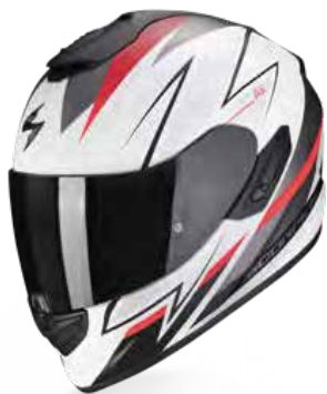
THELIOS | Matt White-Red 369,90 € | 114-402-287