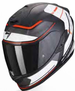
VITTORIA | Matt Black-White 369,90 € | 114-384-227