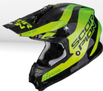
SOUL | Black-Green 169,90 € | 146-376-69