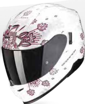
TINA Printed liner 249,90 € Pearl White-Silver 72-357-38 SIZE : XXS-L* ECE22-05