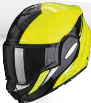
PRIMUS | Neon Yellow-Black 369,90 € / 359,90 € | 118-393-189