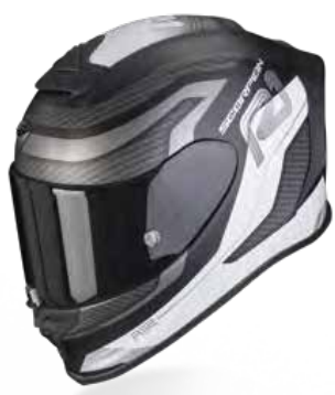
VATIS Black-White 110-374-227 439,90 € / 409,90 €