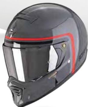
NOSTALGIA | Cement Grey-Black-Red 349,90 € | 87-375-297