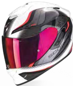
ATTUNE | White-Red 369,90 € | 114-298-59