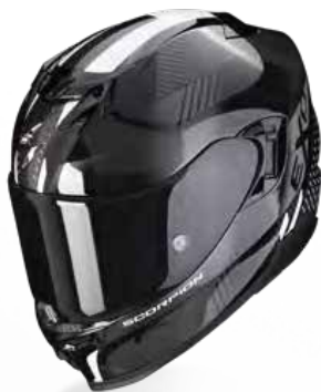
LATEN | Black-White 259,90 € / 249,90 € | 172-358-55