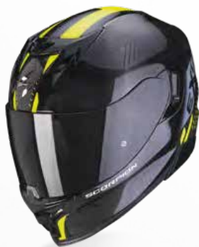
LATEN | Black-Neon Yellow 259,90 € / 249,90 € | 172-358-141