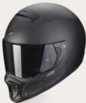
SOLID | Matt Black 439,90 € | 87-261-10