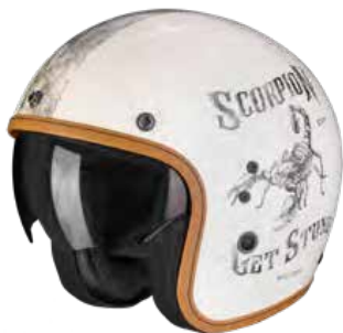
PIQUE | Cream-Black 199,90 € | 72-271-283