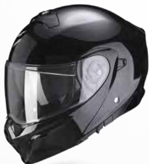
SOLID | Black 229,90 € | 94-100-03 SIZE : XS-XXXL