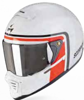
NOSTALGIA | White-Red-Black 349,90 € | 87-375-120