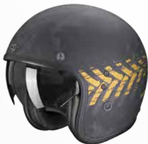
NEVADA | Matt Black-Gold 199,90 € | 78-427-254