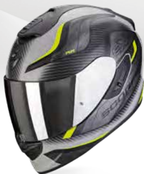
ATTUNE | Matt Grey 369,90 € | Black-Neon Yellow 114-298-300