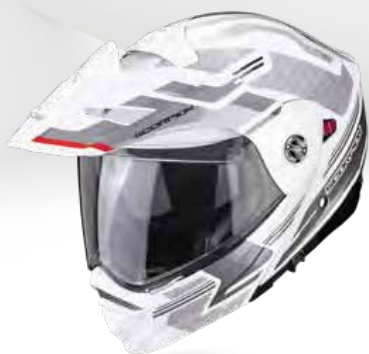
CARRERA | Pearl White-Silver 279,90 € | 89-398-281