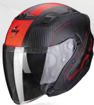
CONDOR | Matt Black-Red 169,90 € / 159,90 € | 23-386-24