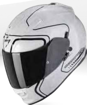
WEST | White-Black 169,90 € | 48-103-63