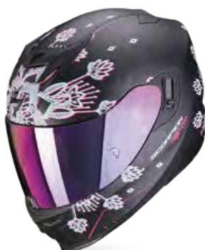
TINA Printed liner 249,90 € Matt Black-Silver 72-357-38 SIZE : XXS-L* ECE22-05