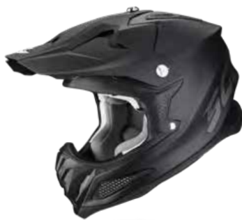
SOLID | Matt Black 299,90 € | 32-100-10