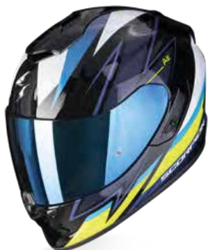
THELIOS | Black-Blue 369,90 € | Neon Yellow 114-402-191