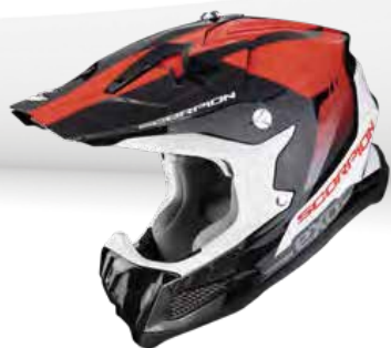
ATTIS Black-Red 349,90 € / 339,90 € | 32-380-24