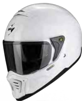
SOLID | White 309,90 € | 87-100-05