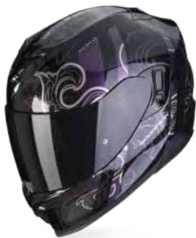
FASTA | Black-Chameleon 259,90 € / 249,90 € | 172-361-38 | SIZE : XXS-XL*