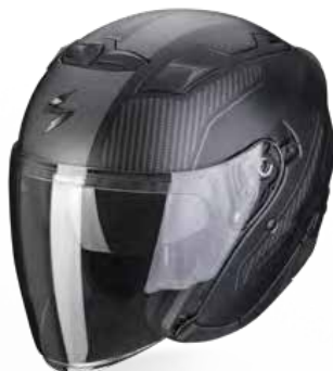
CONDOR | Matt Black-Silver 169,90 € / 159,90 € | 23-386-159