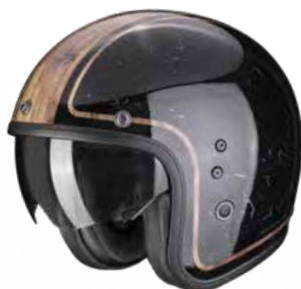
RETROL | Black-Brown 199,90 € | 78-372-145