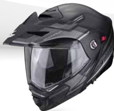
CARRERA | Matt Black-Silver 279,90 € | 89-398-159