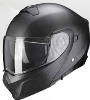
SOLID | Matt Pearl Black 229,90 € | 94-100-285 SIZE : XS-XXXL