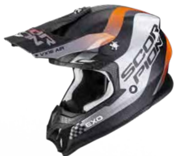
SOUL | Matt Black-Orange 169,90 € | 146-376-168