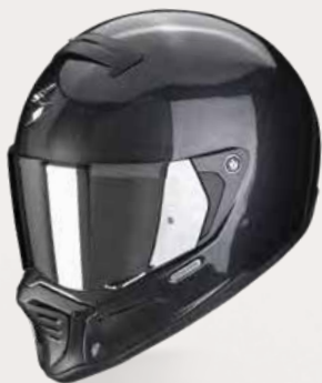
SOLID | Black 439,90 € | 87-261-03 *Silver mirror shield included