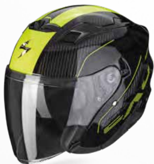
CONDOR | Black-Neon Yellow 169,90 € / 159,90 € | 23-386-141