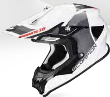
SPECTRUM | White-Silver 169,90 € | 146-400-65