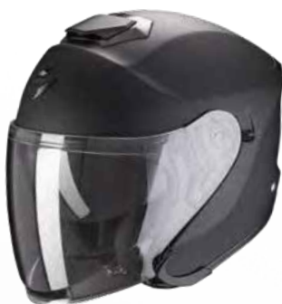
SOLID | Matt Black 199,90 € | 88-100-10