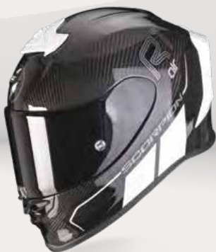
CORPUS II | Black-White 529,90 € / 499,90 € 110-330-55 Size : XS-XL

- Nouveau tarif à partir du 01/01/2023 -