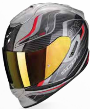
ATTUNE | Grey-Black-Red 369,90 € | 114-298-299