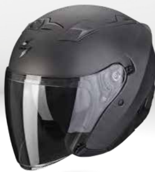
SOLID | Matt Anthracite 149,90 € | 23-100-67