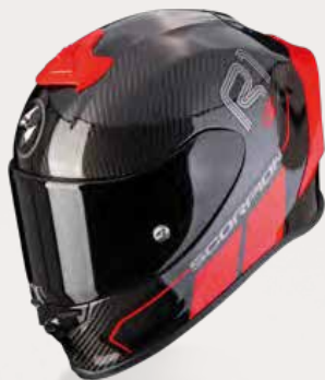
CORPUS II | Red 529,90 € / 499,90 € 110-330-01 Size : XS-XL