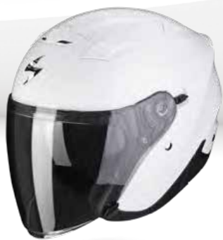
SOLID | White 149,90 € | 23-100-05