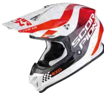
SOUL | White-Red 169,90 € | 146-376-59