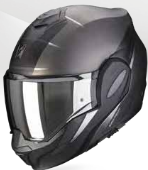
PRIMUS | Matt Silver-Black 369,90 € / 359,90 € | 118-393-232