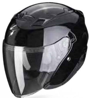
SOLID | Black 149,90 € | 23-100-03