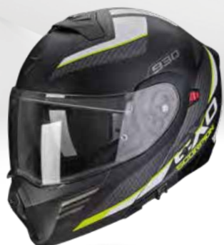
NAVIG | Matt Black 249,90 € | Neon Yellow 94-368-157