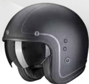
RETROL | Matt Black-Silver 199,90 € | 78-372-159