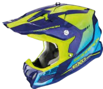
ATTIS Blue-Neon Yellow 349,90 € / 339,90 € | 32-380-203