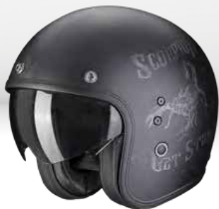
PIQUE | Matt Black-Silver 199,90 € | 72-271-159