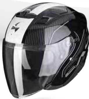
CONDOR | Metal Black-White 169,90 € / 159,90 € | 23-386-294