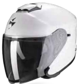
SOLID | Pearl White 199,90 € | 88-100-70