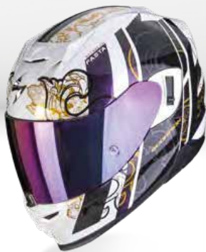
FASTA | White-Chameleon 259,90 € / 249,90 € | 172-361-73 | SIZE : XXS-XL*

- Nouveau tarif à partir du 01/01/2023 -