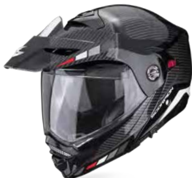
CAMINO | Black-Silver-Red 279,90 € | 89-399-163