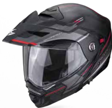
CARRERA | Matt Black-Red 279,90 € | 89-398-24