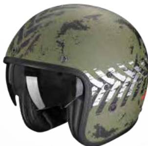
NEVADA | Matt Green-Silver 199,90 € | 78-427-319