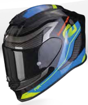
VATIS Black-Blue 110-374-66 439,90 € / 409,90 €