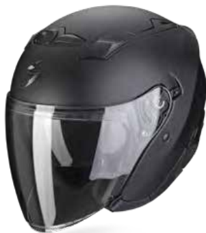
SOLID | Matt Black 149,90 € / 139,90 € | 23-100-10