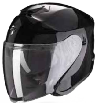
SOLID | Black 199,90 € | 88-100-03