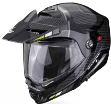
CAMINO | Black-Silver 279,90 € | Neon Yellow 89-399-206