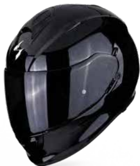
SOLID | Black 149,90 € | 48-100-03