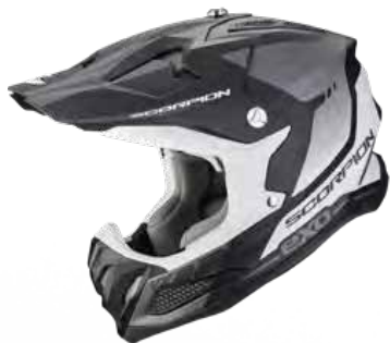
ATTIS Matt Black-Silver 349,90 € / 339,90 € | 32-380-159