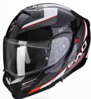
NAVIG | Metal Black-Red 249,90 € | 94-368-238