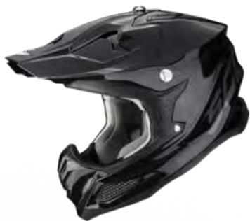
SOLID | Black 299,90 € | 32-100-03