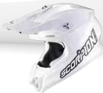
SOLID | White 149,90 € | 146-100-05