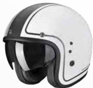
RETROL | Matt White-Silver 199,90 € | 78-372-295