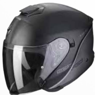
ESSENCE | Matt Black-Silver 239,90 € | 88-391-159