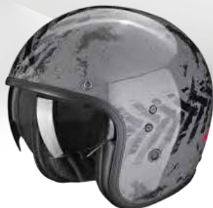
NEVADA | Grey-Black 199,90 € | 78-427-152