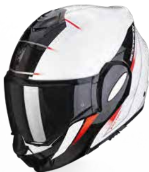
PRIMUS | Pearl White-Black 369,90 € / 359,90 € | 118-393-205