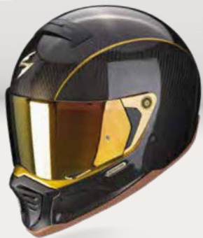
SOLID | Black-Gold 469,90 € | 87-261-61 *Gold mirror shield included