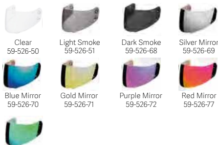
Clear 59-526-50 Light Smoke 59-526-51 Dark Smoke 59-526-68 Silver Mirror 59-526-69 Blue Mirror 59-526-70 Gold Mirror 59-526-71 Purple Mirror 59-526-72 Red Mirror 59-526-77 Green Mirror 59-526-75

Anti-Scratch/ Anti-Scratch 3D/Pinlock MaxVision