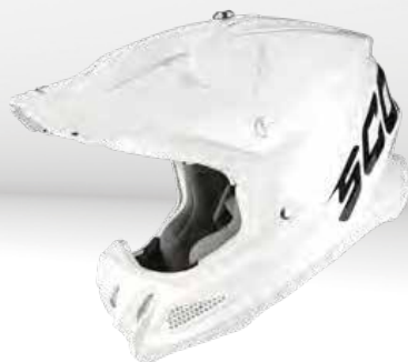
SOLID | White 299,90 € | 32-100-05