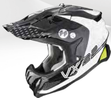
ARES | White-Black Neon Yellow 32-379-207 349,90 € / 339,90 €