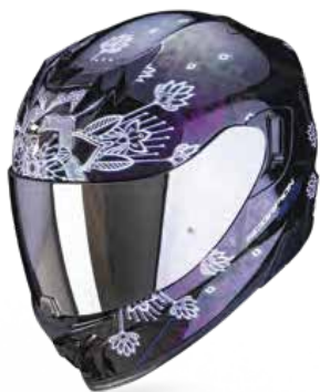
TINA Printed liner 249,90 € Black Chameleon 72-357-38 SIZE : XXS-L* ECE22-05