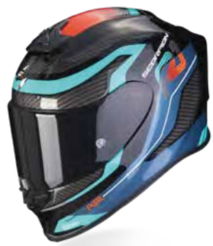
VATIS Black-Blue-Red 110-374-296 439,90 € / 409,90 €