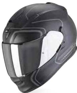
WEST | Matt Black-Silver 169,90 € | 48-103-159