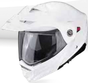
SOLID | Pearl White 249,90 € | 89-100-70