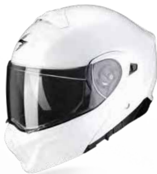
SOLID | White 229,90 € | 94-100-05