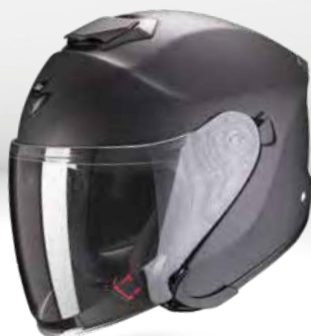
SOLID | Matt Anthracite 199,90 € | 88-100-67