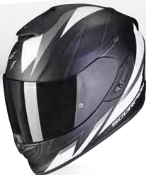
THELIOS | Matt Black 369,90 € | Chameleon 114-402-147