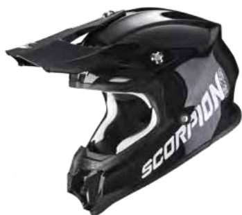
SOLID | Black 149,90 € | 146-100-03