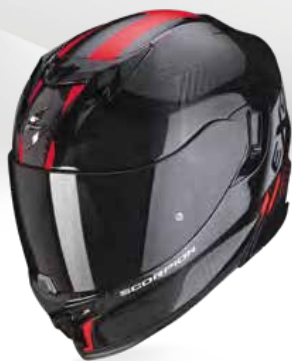
LATEN | Black-Red 259,90 € / 249,90 € | 172-358-24