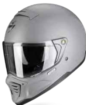
SOLID | Matt Cement Grey 309,90 € | 87-100-228