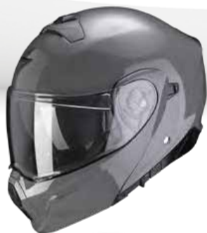
SOLID | Cement Grey 229,90 € | 94-100-253 SIZE : XS-XXXL