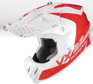
ARES | White-Neon Red 32-379-282 349,90 € / 339,90 €