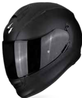
SOLID | Matt Black 149,90 € | 48-100-10 SIZE : XXS-XXXL