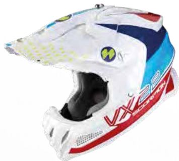
ARES | White-Blue-Red 32-379-236 349,90 € / 339,90 €