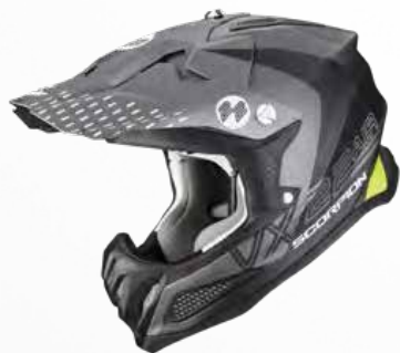
ARES | Matt Black-Silver 32-379-159 349,90 € / 339,90 €