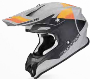
SPECTRUM | Matt Grey-Orange 169,90 € | 146-400-248