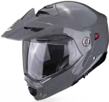
SOLID | Cement Grey 249,90 € | 89-100-253