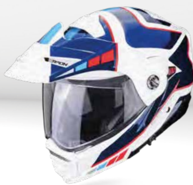
CAMINO | Pearl White 279,90 € | Blue-Red 89-399-236