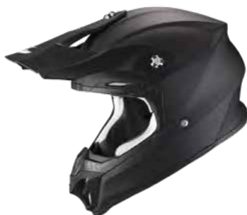
SOLID | Matt Black 149,90 € | 146-100-10