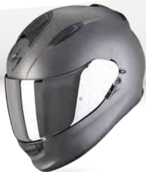
SOLID | Matt Anthracite 149,90 € | 48-100-25