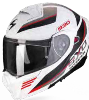
NAVIG | Matt White-Black-Red 249,90 € | 94-368-292