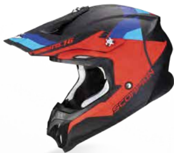
SPECTRUM | Matt Black-Red-Blue 169,90 € | 146-400-305