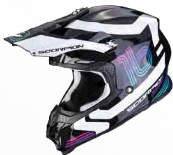
TUB | Metal Black-White 169,90 € | 146-377-55