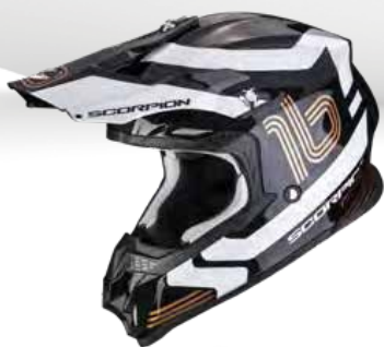
TUB | Metal Black-Gold 169,90 € | 146-377-61