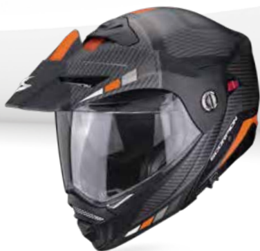
CAMINO | Matt Black 279,90 € | Silver-Orange 89-399-304