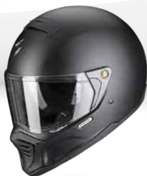
SOLID | Matt Black 299,90 € | 87-100-10